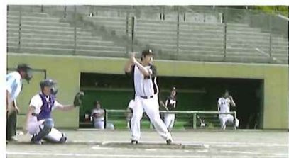
夏の地区予選で打席に入る筆者